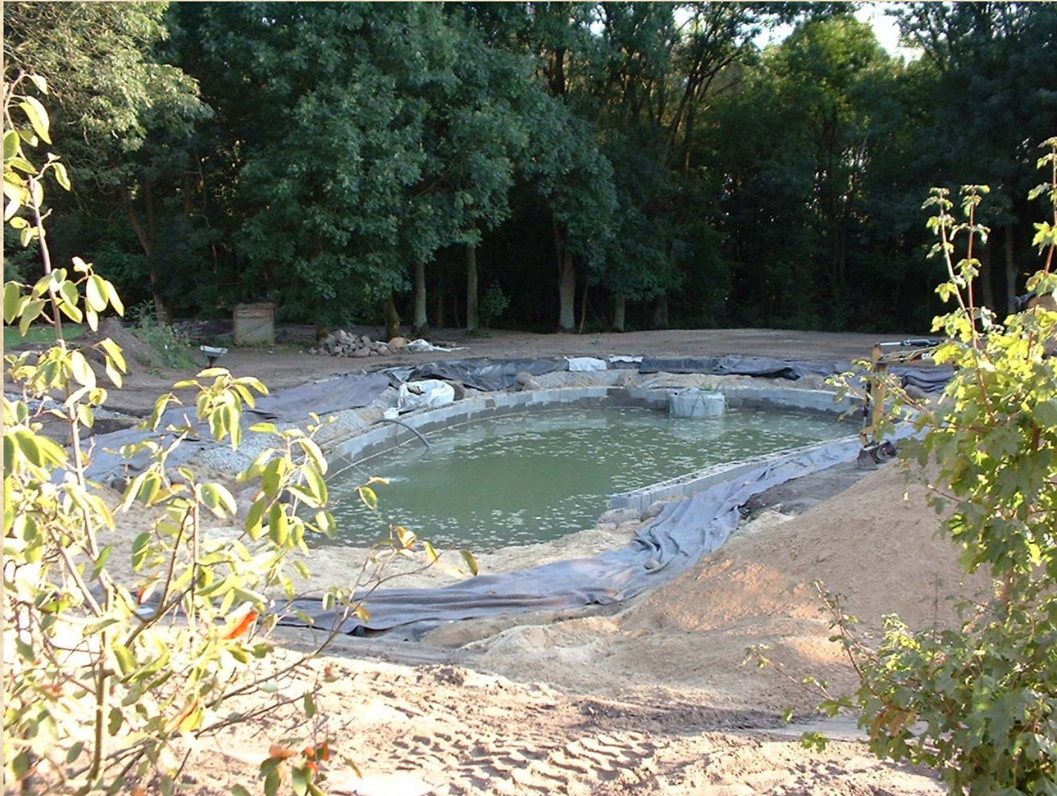
Bild 12 1. Füllen des Schwimmbereiches mit Wasser 05.09.02