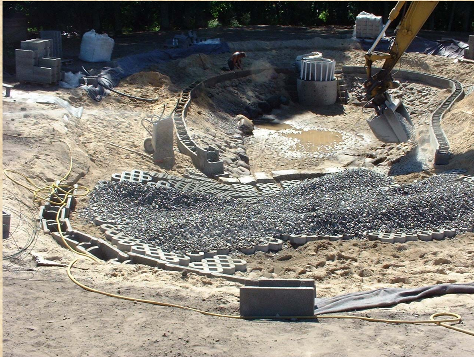
Bild 11 Befestigung des Flachwasserbereiches 02.09.02