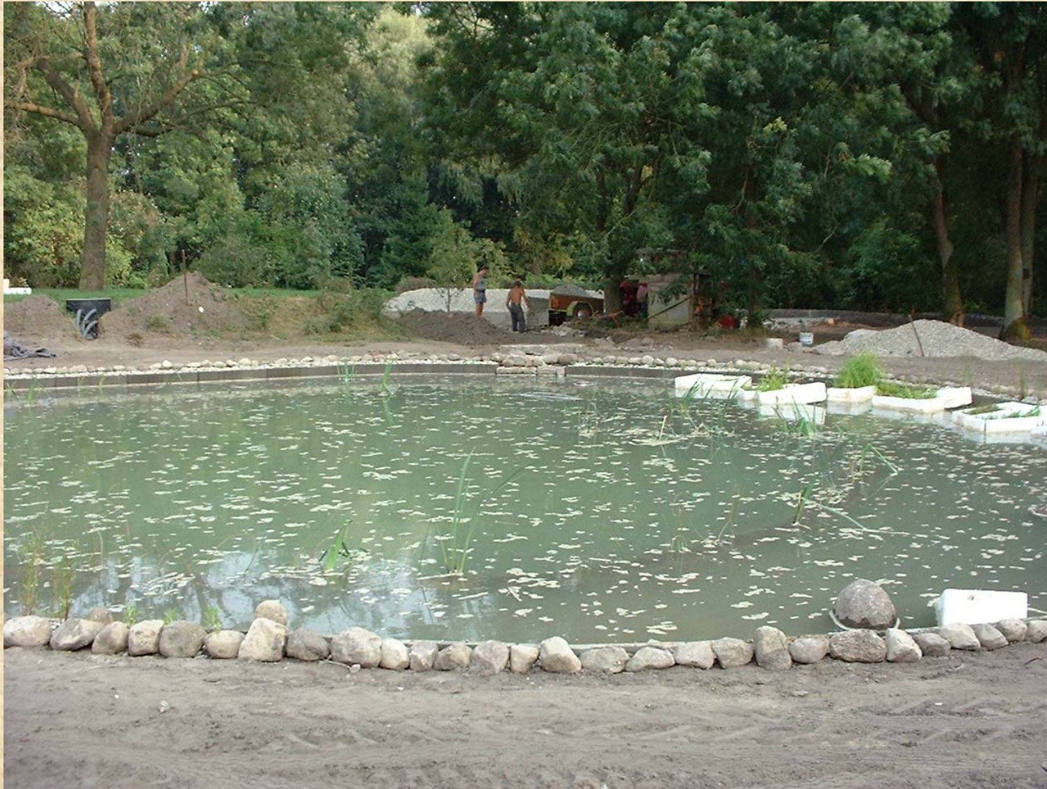
Bild 14 Erstbepflanzung und Randgestaltung 10.09.02