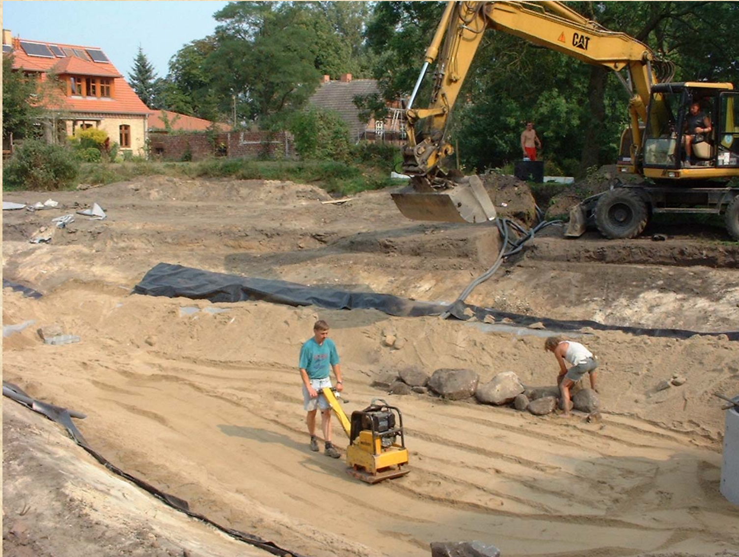
Bild 6 Verdichten der Kiesschicht 28.08.02