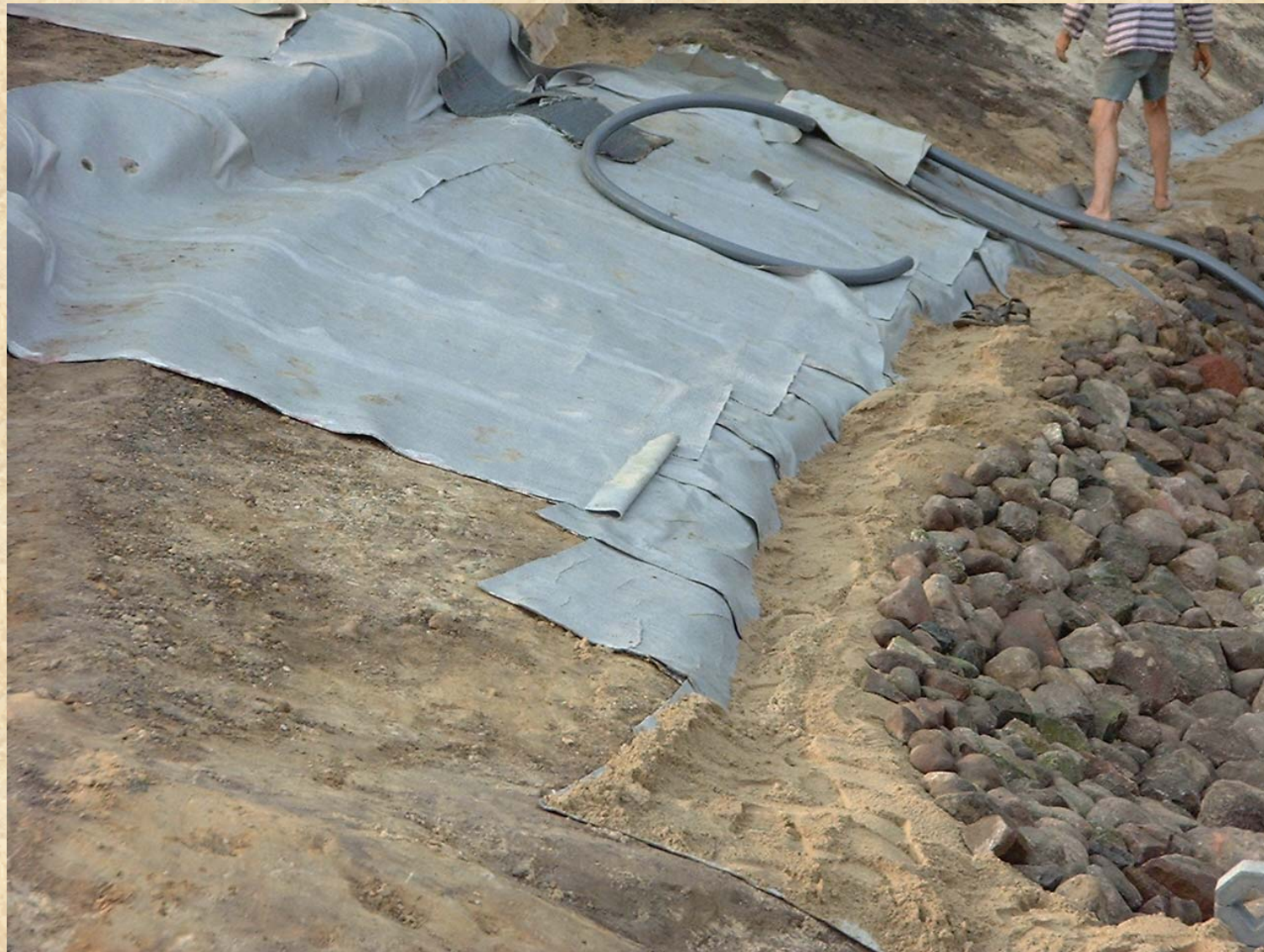
Bild 7 Verlegen der Leitungen, Abdecken der Böschung mit Feldsteinen 28.08.02