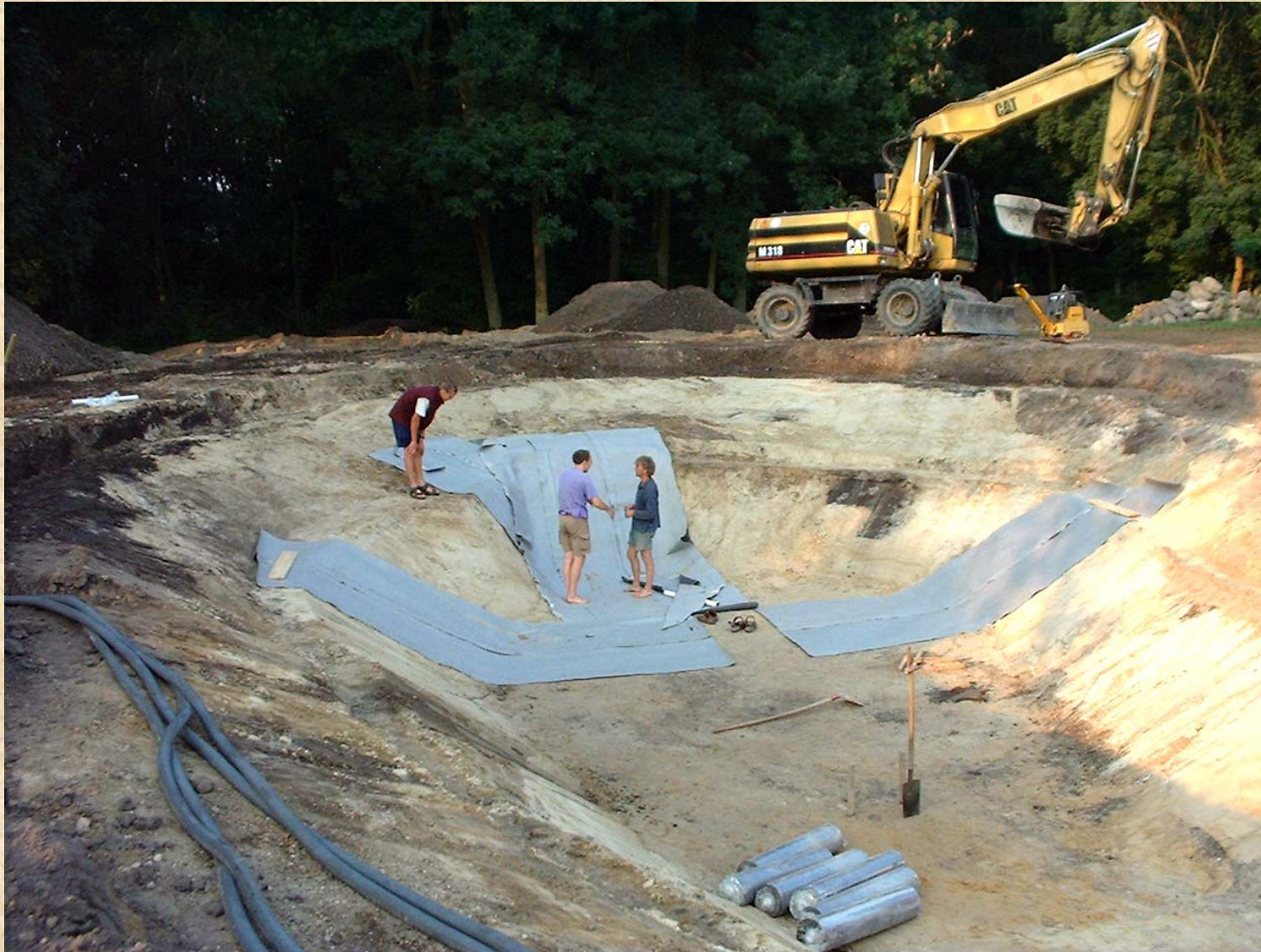
Bild 2 Verlegen der Tonabdichtung 27.08.02