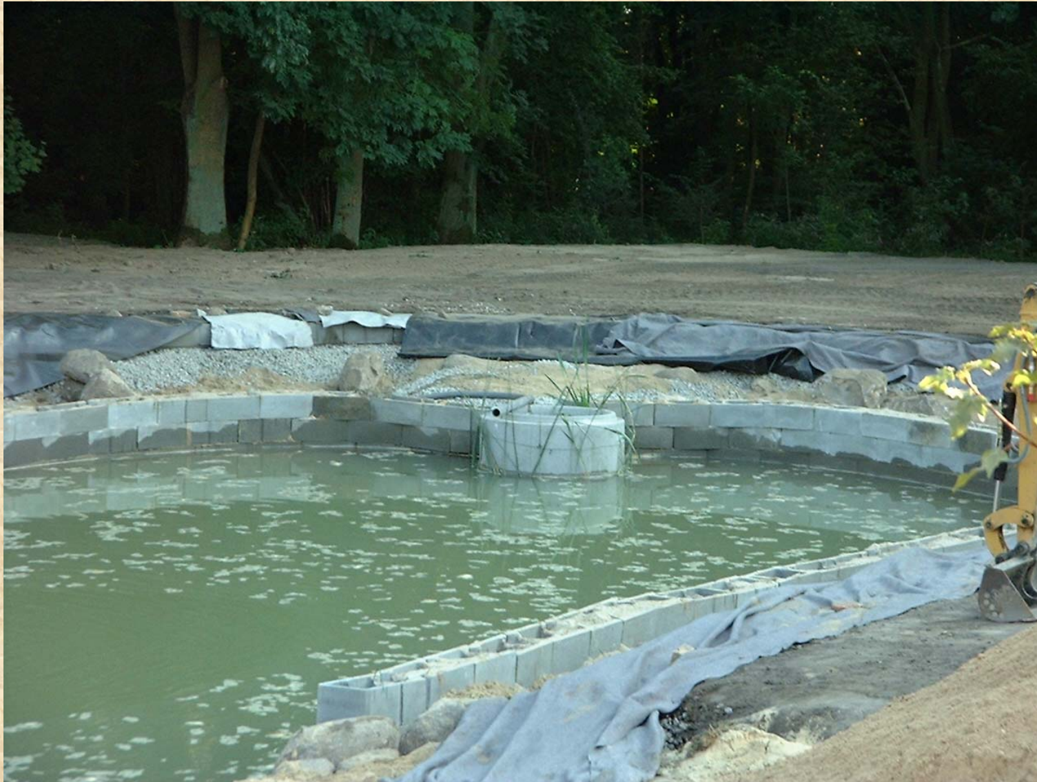
Bild 13 Abgrenzung zum Regenerationsbereich in voller Höhe 05.09.02