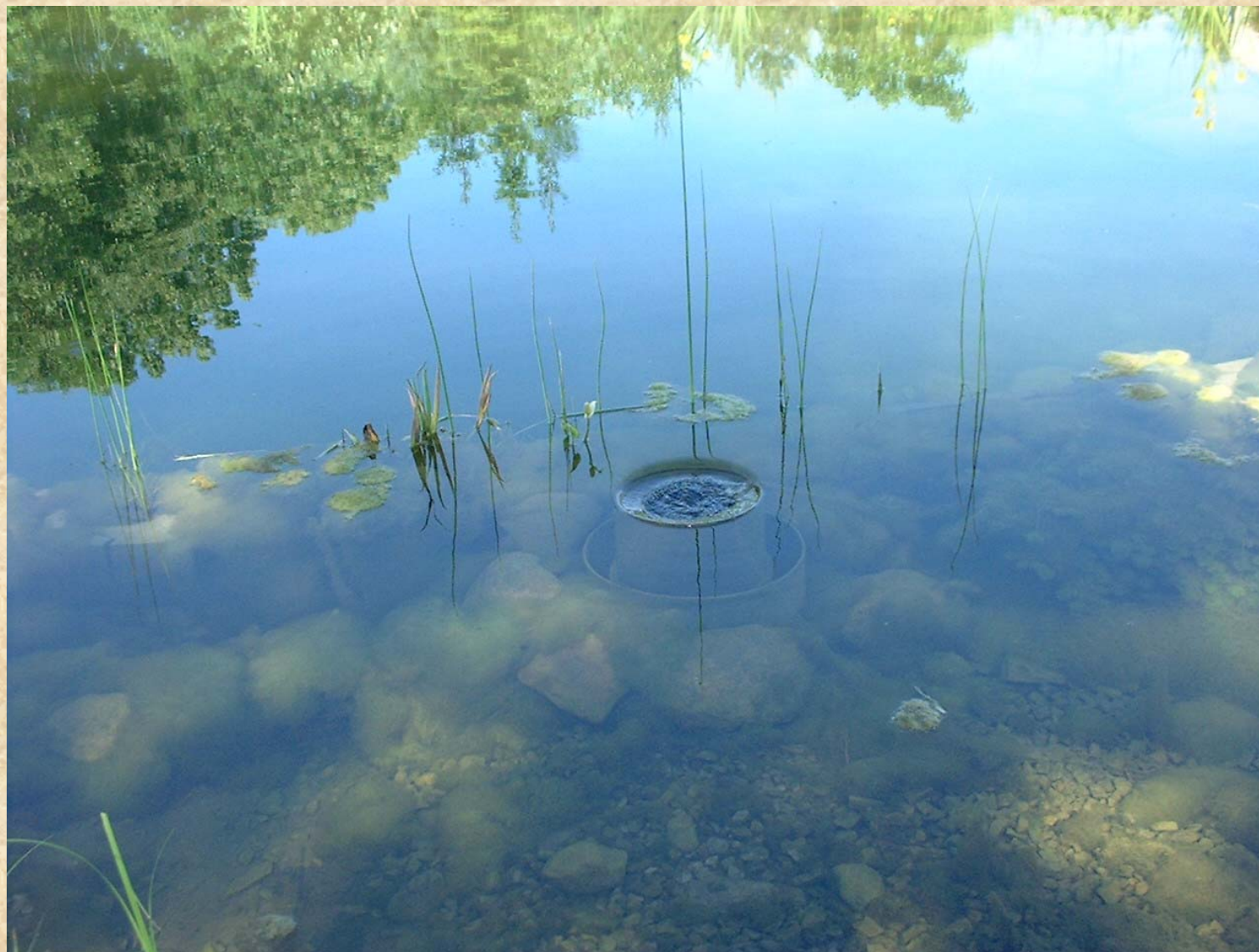
Bild 16 Skimmer in Aktion 28.05.03