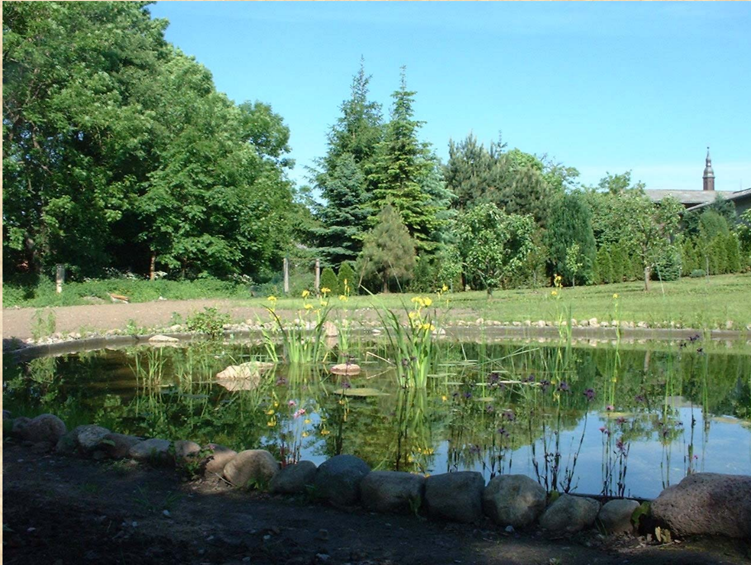
Bild 17 Beschattung der Anlage am Vormittag 28.05.03