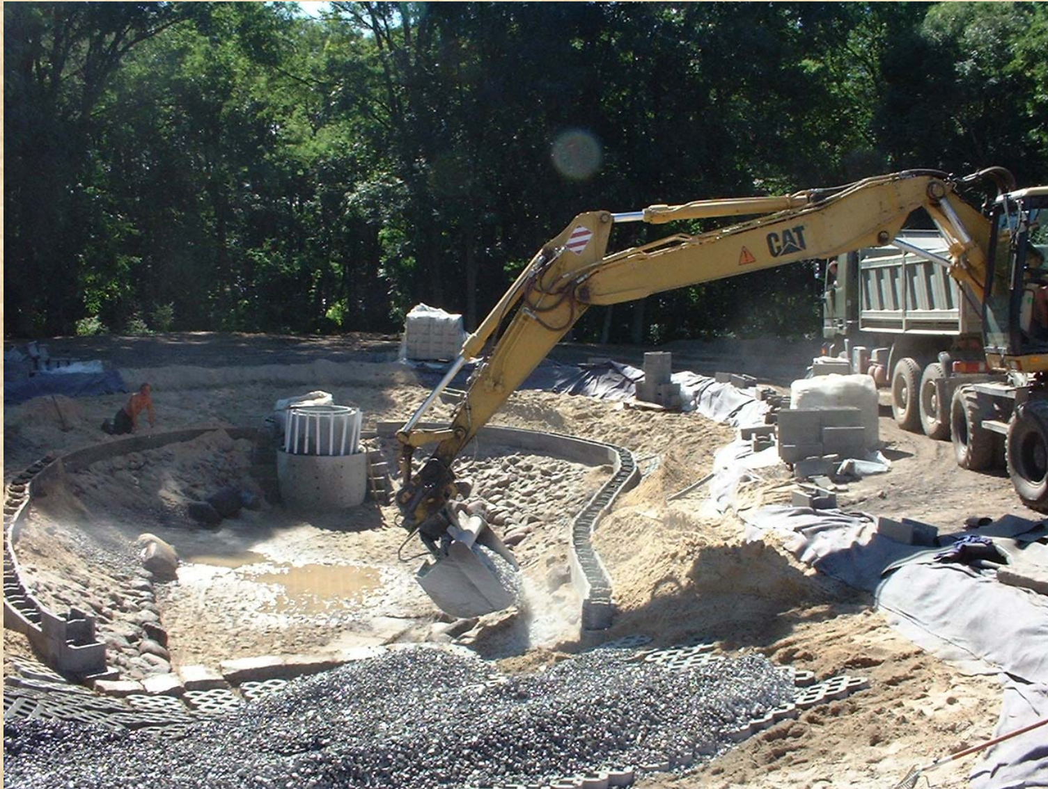
Bild 10 Arbeitsfortschritt am 02.09.02