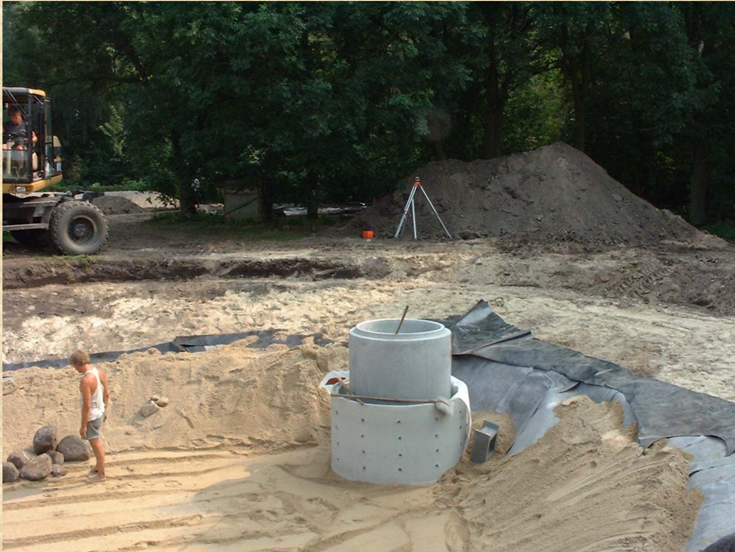
Bild 5 Einbau des Filterschachtes, Abdecken der Tondichtung mit Kies 28.08.02