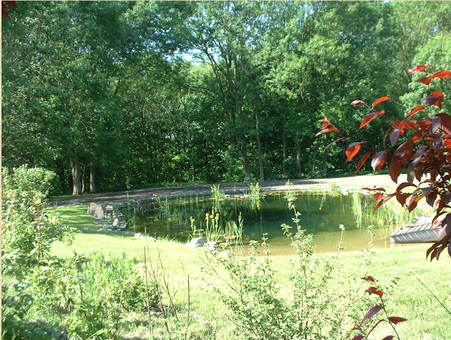
Bild 15 Anlage nach dem 1. Winter 28.05.03