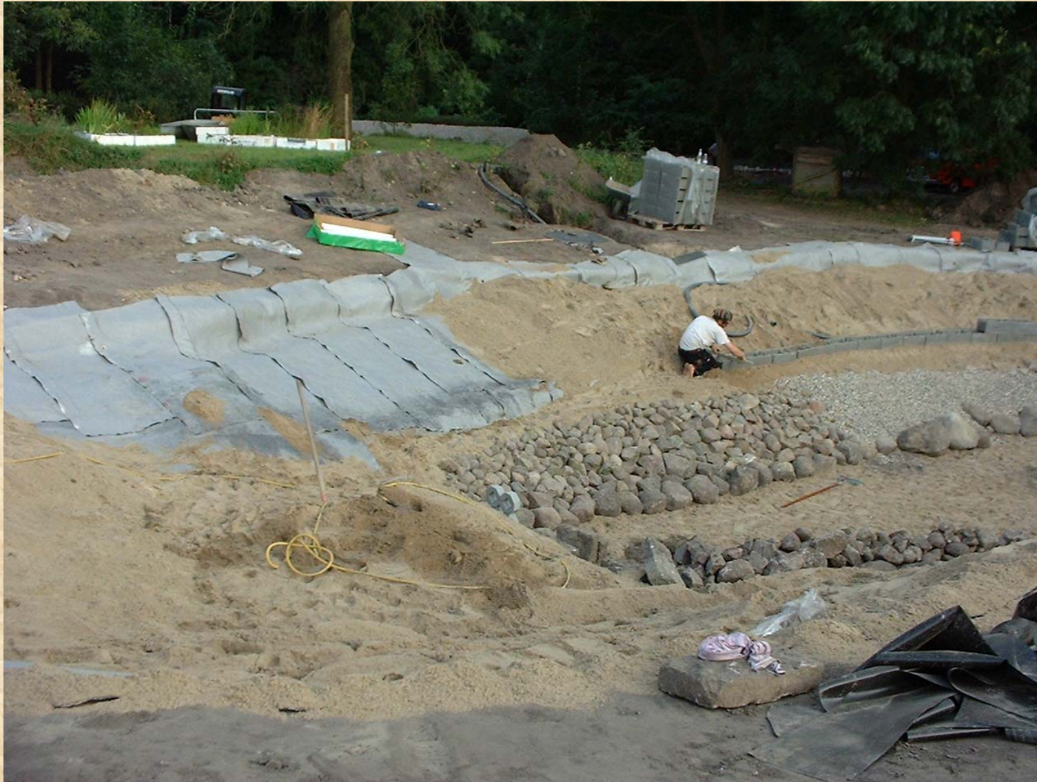
Bild 8 Verlegen von Begrenzungssteinen zur Abgrenzung des Schwimmbereiches 29.08.02