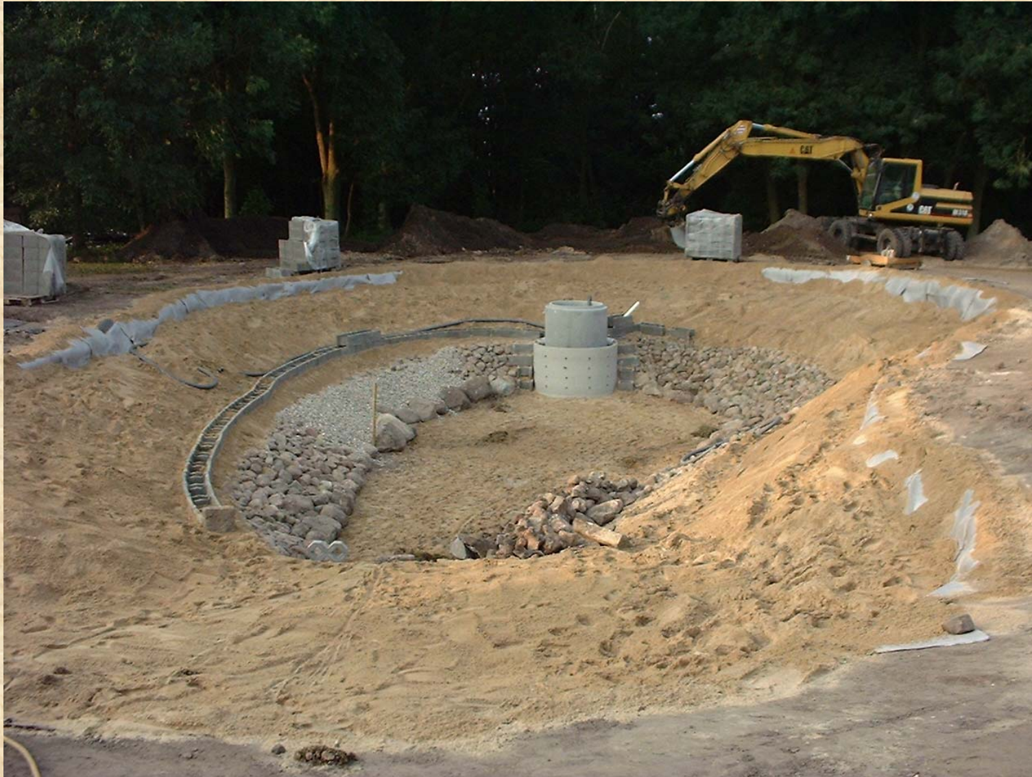
Bild 9 Arbeitsfortschritt am 29.08.02