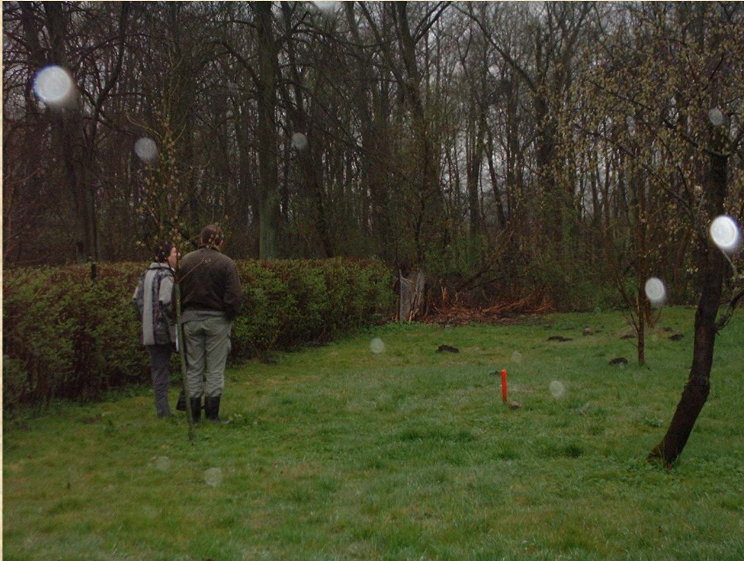
Bild 1 1. Ortsbesichtigung am 15.04.02